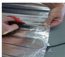
Koniec strihu. POZOR na kábel!