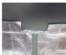
Výsledný tvar, netreba lepiť spoje.